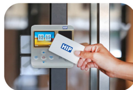
Time Attendance Card